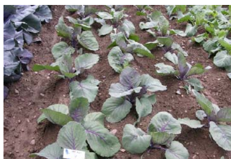
Feldbestand 4 Wochen nach Pflanzung